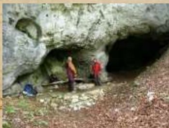
Mornova zijalka Naravna jama v bližini Belih vod.