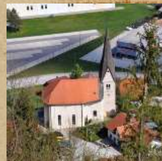
Cerkev sv. Mohorja in Fortunata Nastala je najbrž kot grajska kapela Šoštanjskih gospodov. V 18. stoletju so jo podrli (razen zvonika) in zgradili baročno stavbo.