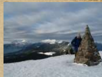
Smrekovec Ugasli ognjenik. Je življenjski prostor redkih in ogroženih živali in rastlin.