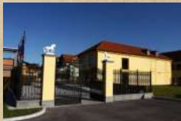
Muzej usnjarstva Šoštanj Vošnjakova usnjarna je obsegala območje, tako veliko kot trg Šoštanj. Večino so jo porušili leta 2002.