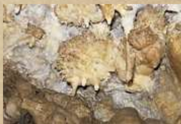
Rotovnikova jama Podzemna jama v kateri so poleg kapnikov znameniti aragonitni ježki (kristali zrastejo v krhke iglice in dajejo vtis ježka).