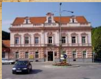
Kajuhov dom Najbolj razkošno oblikovan manjši hotel na slovenskem Štajerskem v 19. stoletju.