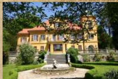
Dvorec Ravne Gutenbuchel Stoji v geometrično oblikovanem parku, tam so bile bogate ograje, vodnjak, bazen, steklenjak...