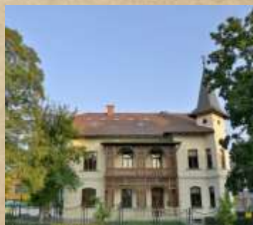
Vila Mayer V prenovljeni vili so zgodovinske in umetnostne zbirke.