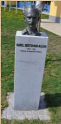
Karel Destovnik - Kajuh