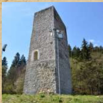
Grad Šoštanj (Pusti grad)