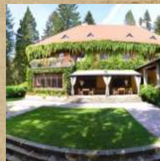
Vila Široko Zgradil jo je lastnik Šoštanjske usnjarne Herbert Woschnagg. Obdajal jo je svoboden park z bazenom in teniškim igriščem.