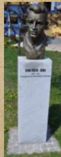
Ivan Röck - Biba