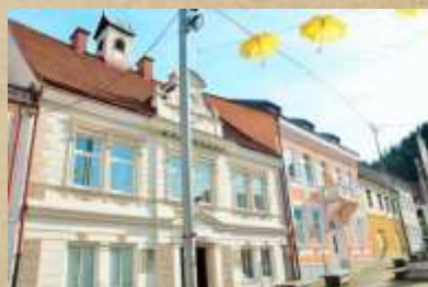
Stara trška hiša (magistrat) Prvotno je bila špital (ubožnica, hiralnica). Na strehi je stolpič z uro in dvema zvonovoma.