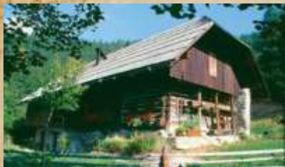
Kavčnikova domačija Najjužnejša ohranjena alpska dimnica v Evropi. Domačija v Zavodnjah je urejena kot muzej.