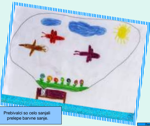
Prebivalci so celo sanjali prelepe barvne sanje.