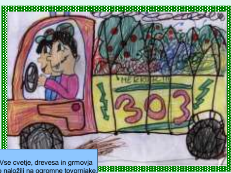
Vse cvetje, drevesa in grmovja so naložili na ogromne tovornjake