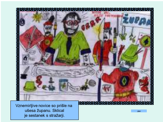
Vznemirjive novice so prišle na ušesa županu. Skical je sestanek s stražarji.