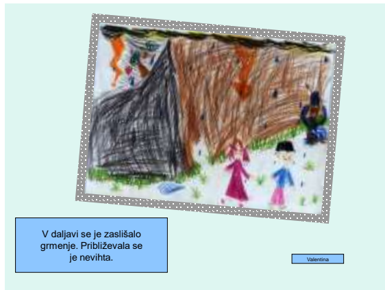
V daljavi se je zaslislalo grmenje. Približevala se je nevihta.