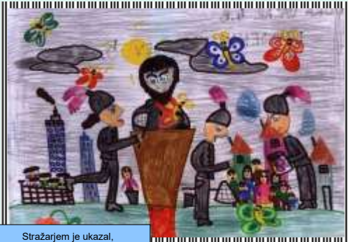
Stražarjem je ukazal, naj z mrežami polovijo živopisane metulje.