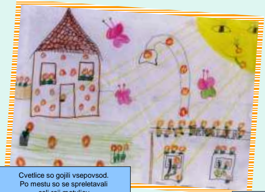
Cvetlice so gojili vsepovsod. Po mestu so se spreletavali celi roji metuljev.