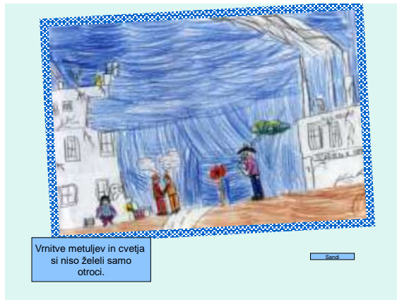
Vrnitve metuljev in cvetja si niso želeli samo otroci.