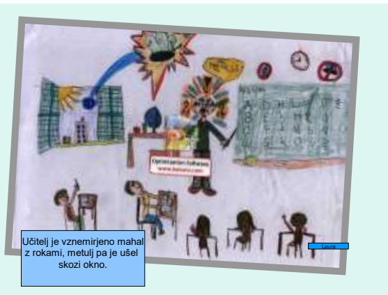
Učitelj je vznemirjeno mahal z rokami, metulj pa je ušel skozi okno.