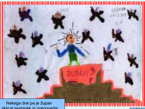
Nekega dne pa je župan sklical sestanek in prepovedal gojiti cvetje.