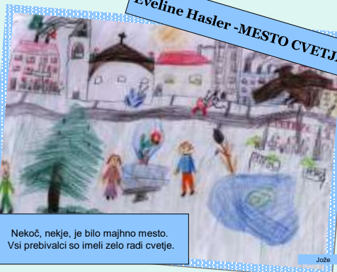
Nekoč, nekje, je bilo majhno mesto. Vsi prebivalci so imeli zelo radi cvetje.