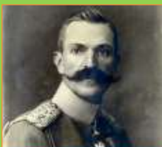
RUDOLF MAISTER (1874–1934)

(Nemci se umikajo, Slovenec, 26. novembra 1918)