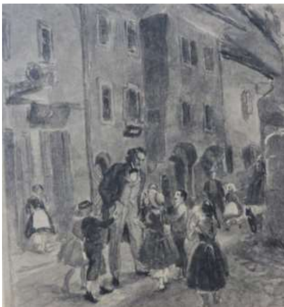
France Prešeren med kranjskimi šolarji

Če dobiš navdih, se lahko preizkusiš tudi v pesnjenju in sestaviš pesem o Prešernu. Navodilo za to delo je 7. naloga.