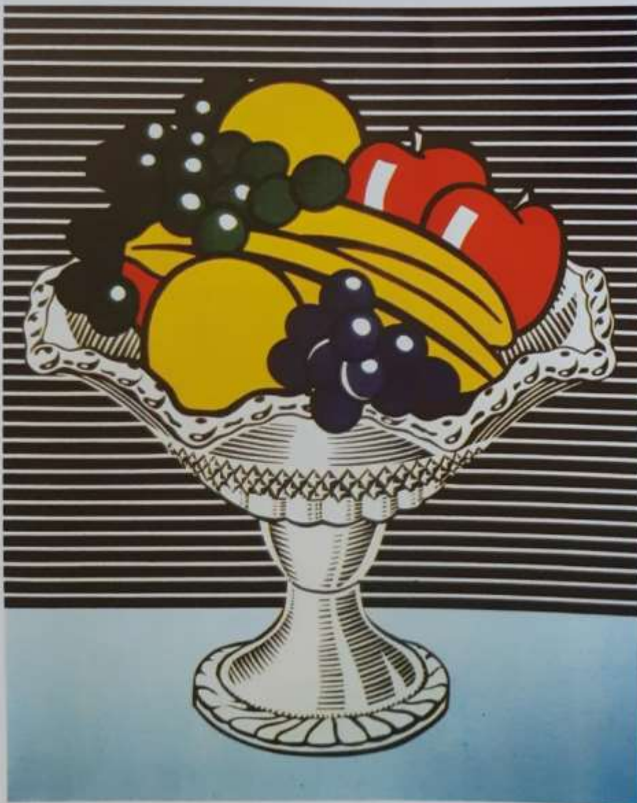
Roy Lichtenstein: Tihožitje v kristalni posodi, 1973