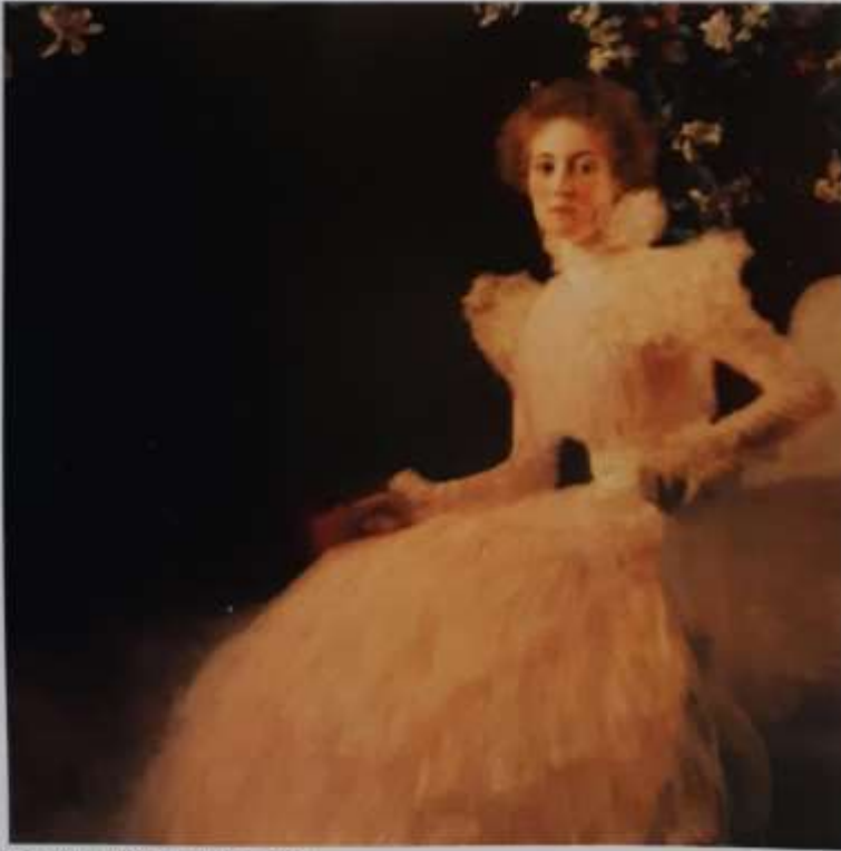
Gustav Klimt: Portret Sonje Krups, 1906

Upodablamo lahko ljudi, živali, rastline, predmete, kakršne vidimo v naravi ali si jih predstavljamo v domišljji.