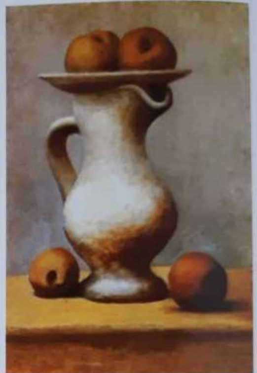
Pablo Picasso: Tihožitje, 1921