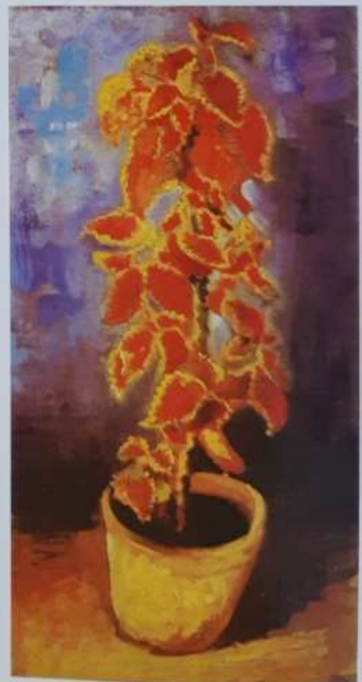
Vincent van Gogh: Cvetlica v lončku, 1886