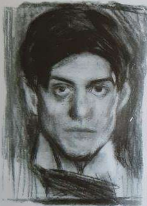
Pablo Picasso: Avtoportret, 1990

Če ustvarjalec upodobi sebe, izdela avtoportret . Lahko se upodobi od spredaj (en face) ali od strani (profil). Upodobi lahko samo glavo, glavo z oprsem, postavo do kolen, celo postavo.