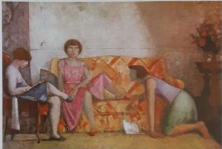
Balthus: Tri sestre I, 1965