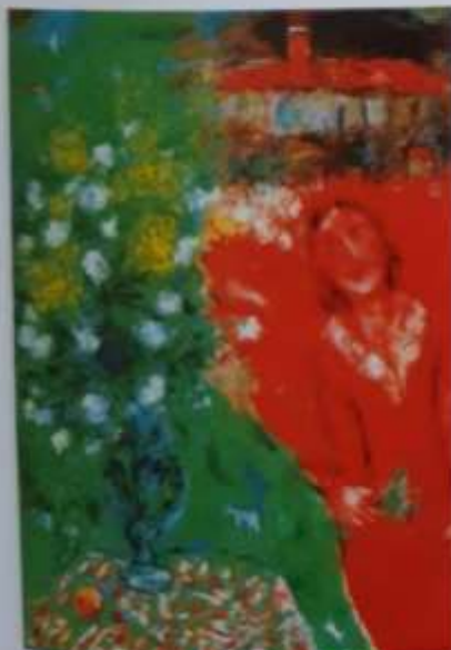
Mark Chagall: Sikar in njegova žena, 1969