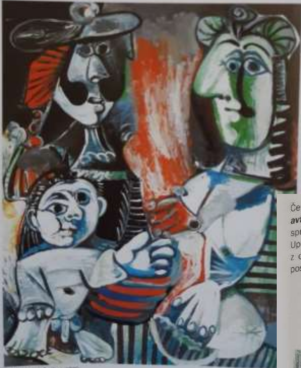
Pablo Picasso: Sebi, 1970

Če ustvarjalec upodobi sebe, izdela avtoportret . Lahko se upodobi od spredaj (en face) ali od strani (profil). Upodobi lahko samo glavo, glavo z oprsem, postavo do kolen, celo postavo.