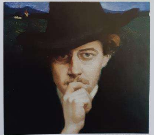
Maksim Gaspari: Avtoportret, 1905