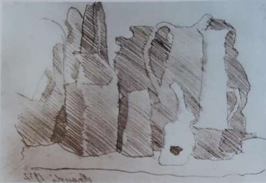
Giorgio Morandi: Tihožitje, 1949

Ustvarjalec lahko upodobi tudi ne- gibne stvari (predmete, sadeže, cve- tlice, mrtve živali ...). Pravimo, da je upodobil tihožitje.