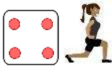
IZMENIČNO Z LEVO IN DESNO NOGO