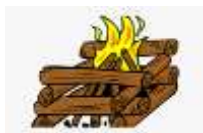
Praznik dela 1. in 2. maj