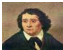
Slovenski kulturni praznik 8. februar