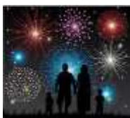
Novo leto 1. in 2. januar