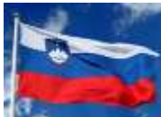
Dan državnosti 25. junij