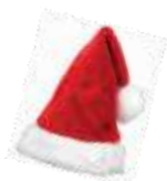
Božič 25. december