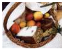
Velika noč april