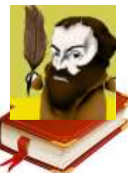
Dan reformacije 31. oktober