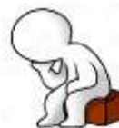
Dan samostojnosti in enotnosti 26. december