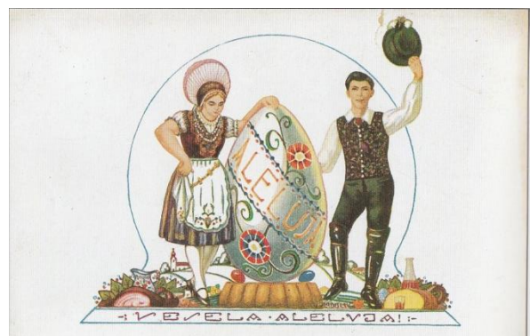
Velikonočna voščilnica s srede 20. stoletja

Tebi in tvojim domačim, želim lepe praznike.