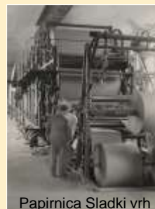
Papirnica Sladki vrh