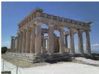
Rimski tempelj (svetišče za verske obrede)