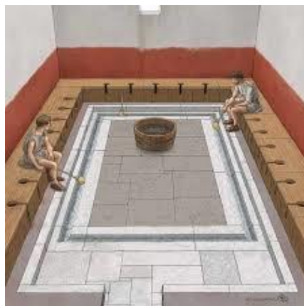
Rimsko javno stranišče