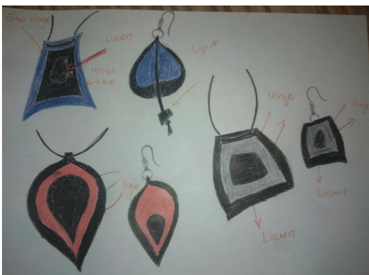
Seti ženskega nakita