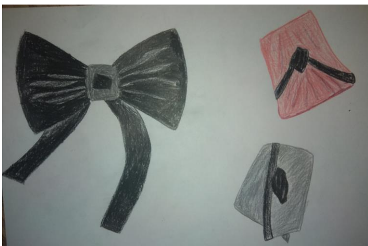
Galanterija za moške

Za moške smo izdelali dva kravatna obročka ter metuljčka v dveh barvnih kombinacijah. Prikaz na skicah: