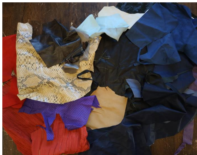
Kosi usnja pred izdelavo

Najprej smo pretipali in si ogledali kose usnja, ki smo ga dobili v uporabo, ter razmišljali na kakšen način bi ga lahko oblikovali v neke nove in originalne izdelke... do končnih idej smo prišli s poskušanjem. Iz usnja smo oblikovali različne tulce, ga izrezovali, lepili, prepogibali in poskušali najti različne načine uporabe.