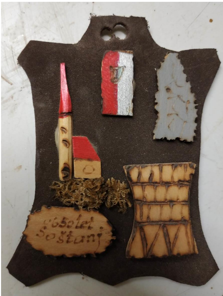
Šoštanj na usnju

Izdelki iz lesa so kot dodatek k naši turistični nalogi, a zdelo se nam je prav, da pokažemo, da se v našem kraju posamezniki trudijo tudi na tem področju turizma.