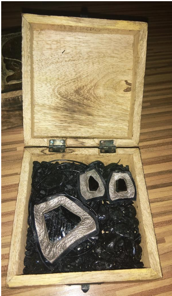
Svetleči stolp – Lepi kamen