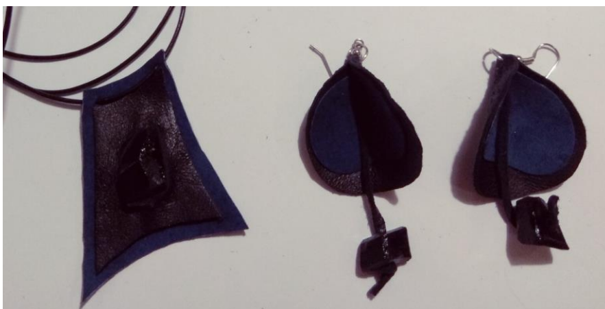
Družmirske solze – Lepi kamen

- skozi zgornji stisnjeni in zalepljeni del s šivanko naredimo luknjico in skozi njo vdenemo obroček z osnovo za viseče uhane, ga s kleščami stisnemo in uhan je izdelan. Postopek ponovimo še pri drugem uhanu.