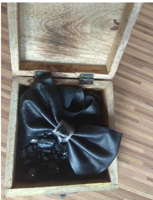
Elegantni metuljček Lepi kamen

Iz črnega usnja po vnaprejšnjem modelčku (pravokotnik z merami a = 20 cm, b = 5,5 cm) izrežemo usnje in iz obeh strani prepognemo navznoter proti sredini in tam zlepimo skupaj. Nato natančno zlepimo še spodnji in zgornji stranici, da dobimo lepo oblikovan pravokotnik. Iz sivega usnja izrežemo dva trakova: prvi je dolg 4 cm in širok 1,5 cm, drugi je enako dolg a širok 2 cm. Pravokotnik prepogibamo kot harmoniko in ga s prsti na sredini stisnemo skupaj, da dobimo obliko metuljčka. Z ožjim sivim trakom ga objamemo in na notranji strani metuljčka trak zalepimo, da metuljček obdrži obliko. Nato na sredino metuljčka (na sivo usnje) nalepimo manjši košček lignita. V drugi trak sivega usnja vrežemo odprtino za lignit ter ga potegnemo čez lignit, tako, da ga lepo zaobjame. Trak na zadnjem delu metuljčka natančno zalepimo. Skozi ta trak povlečemo 25 cm dolg in 2 cm širok črni, usnjeni trak za zavezovanje in spominek je dokončan.