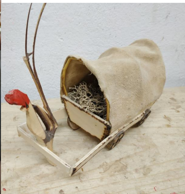
Petelin vleče voz