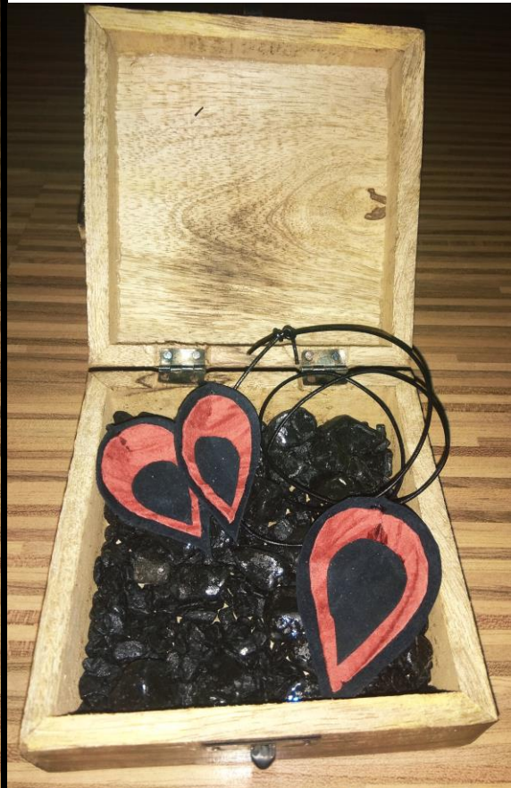
Ognjena strast – Lepi kamen